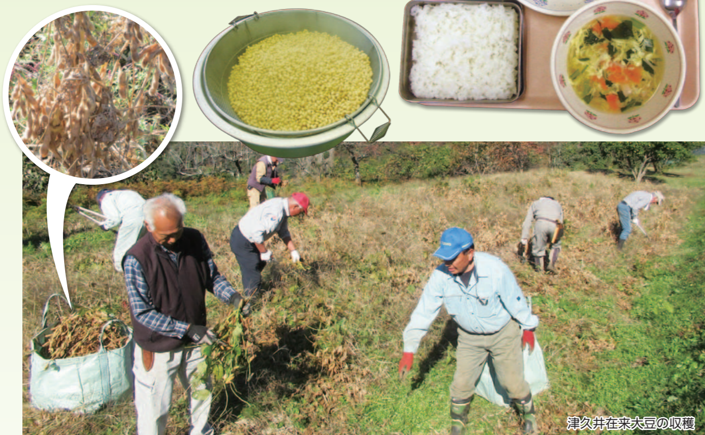
マーボー大豆丼の具