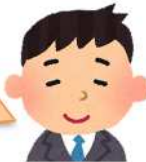
グループワークで出された意見

今回の市民検討会では、引き続き実現に向けた課題や解決策の検討を中心にグループワークを行います。オープンハウスに向けて、たくさんのお意見を出し合ひましょう！