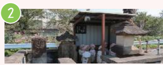
2 宮下本町三丁目の歴史的石像群 宮下本町3-7付近 地域の歴史を伝える石碑を学ぼう