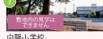
7 向陽小学校 向陽町8-33 長いすべり台のある小学校