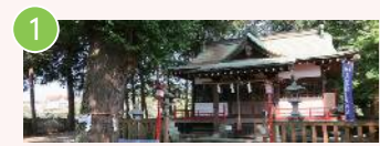
1 天縛皇神社 宮下本町3-23-7 室町時代から地域に親しまれるお宮さん