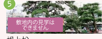
5 根上松 南橋本1-6付近 歴史的ランドマークの指定保存樹木