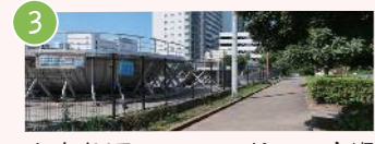
3 小山公園ニュースポーツ広場 小山4-1 世界で活躍する一流選手を輩出した聖地