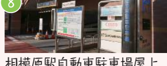
8 相模原駅自動車駐車場屋上 相模原1-1-20 駐車場の屋上から補給廠返還地を一望！