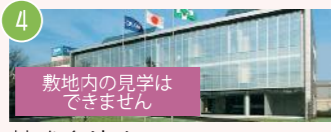
4 株式会社オハラ 小山1-15-30 世界に誇る巨大レンズを見学しよう