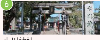
6 氷川神社 清新4-1-5 新田開墾の歴史が残る地域のシンボル