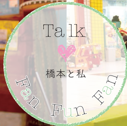
撮影協力 DEL GLUTTON DINER ☎042-703-5550

橋本生まれ橋本育ち。 新宿で仕事をするようになった今も橋本に住み続け、橋本を愛する理由を伺いました。