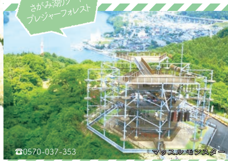
さがみ湖リゾート プレジャーフォレスト