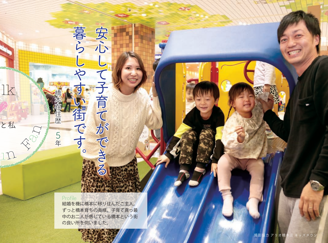
撮影協力 アリオ橋本店 キッズタウン

結婚を機に橋本に移り住んだご主人。 ずっと橋本育ちの奥様。子育て真っ最中のお二人が感じている橋本という街の 良い所を伺いました。