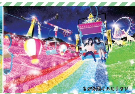
ハッスルスパイダー