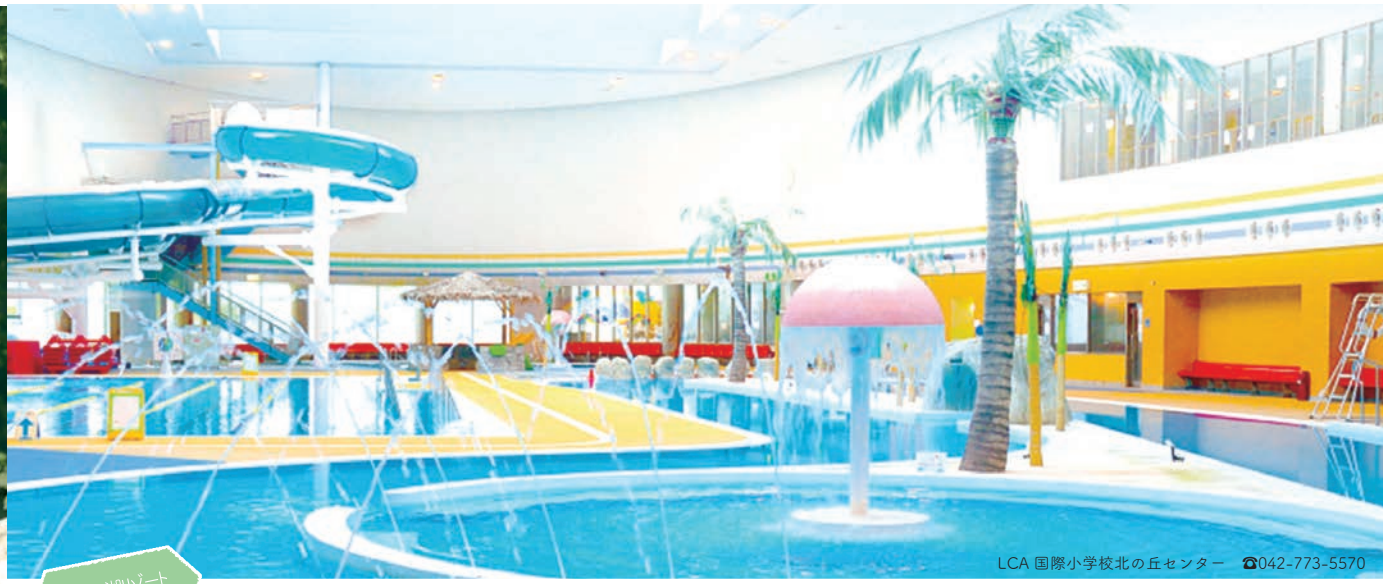
LCA 国際小学校北の丘センター ☎042-773-5570