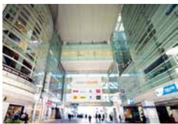
相模大野ステーションスクエア

相模大野は都内への通勤や、観光地へのお出かけにもとても便利。小田急線相模大野駅を玄関口として、都心へは最短でおよそ35分、神奈川県下の主要観光地へもおよそ40分～60分で