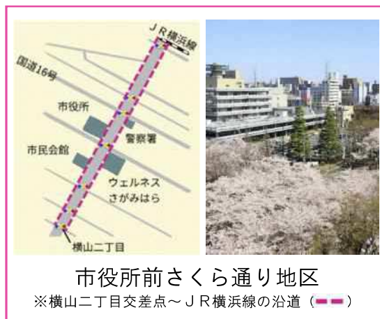
市役所前さくら通り地区

自治会や商店街、地域にお住まいの方などで構成される「市役所前さくら通り地区景観協議会」でご意見を伺いながら進めてきました。令和元年12月15日（日）に第7回景観協議会を開催し、これをもって、予定していた景観協議会は全て終了しました。