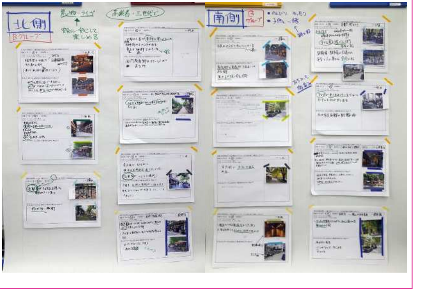
Bグループの成果（地区の将来像）