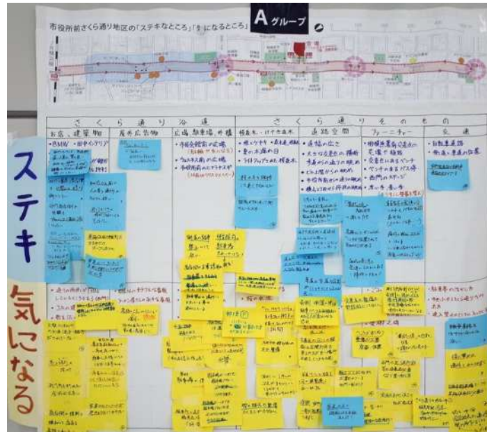
Aグループの成果（地区の魅力と課題）