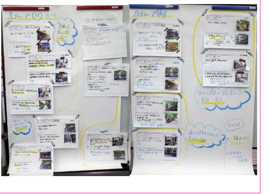
Aグループの成果（地区の将来像）