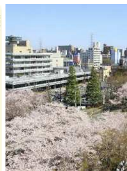
市役所前さくら通り地区 ※横山二丁目交差点～JR横浜線の沿道（---）