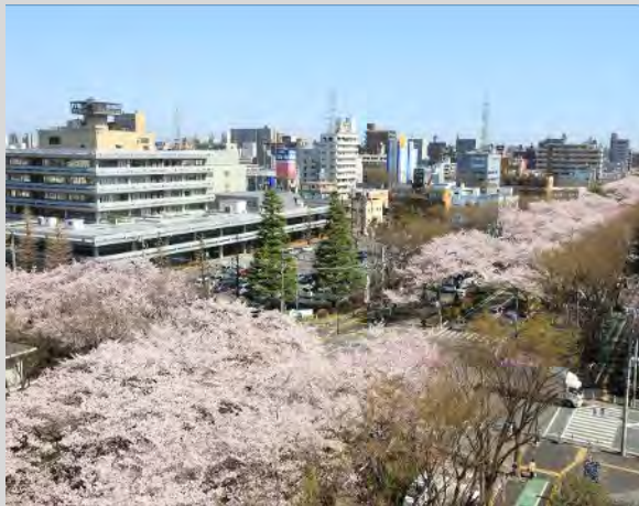
アンケートの対象となる市道市役所前通の区間

今回のアンケートは、市道市役所前通のうち、JR横浜線の踏切付近から横山2丁目交差点までの区間を対象とします。