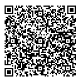
難病のある方の在宅療養に関する アンケート調査結果報告 [概要版]