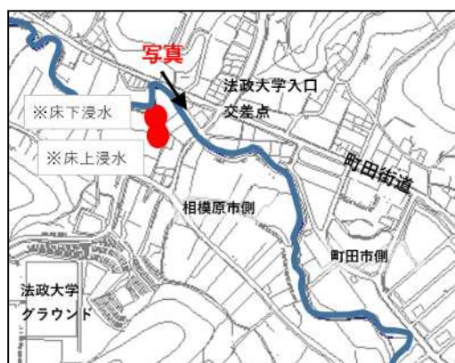
令和元年東日本台風における被害状況

こうしたことから、県民・市民の生命・財産を守るため、境川水系河川整備計画に基づいた早急な河川改修をお願いするとともに、放流量の抑制見直しの具体化について、より一層の取組を進めるよう強く要望します。