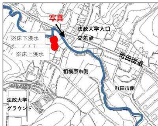
令和元年東日本台風における被害状況

こうしたことから、県民・市民の生命・財産を守るため、早急な河川改修をお願いするとともに、放流量の抑制見直しの具体化について、より一層の取組を進めるよう強く要望します。