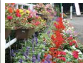
花のまちづくり・みどりいっぱい運動