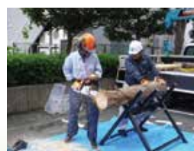
チェーンソー特別教育