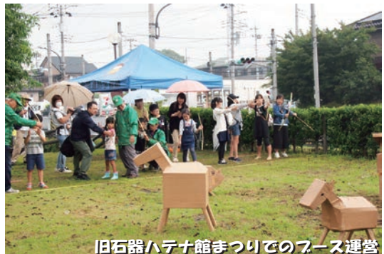
旧石器ハテナ館まつりでのブース運営