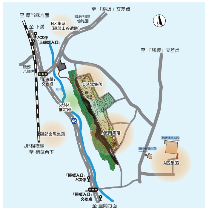
図3 探訪で巡った縄文時代の集落跡

勝坂遺跡の活用には、遺跡としての価値、公園としての魅力を市民の皆さんに伝えることが大切であると実感しました。