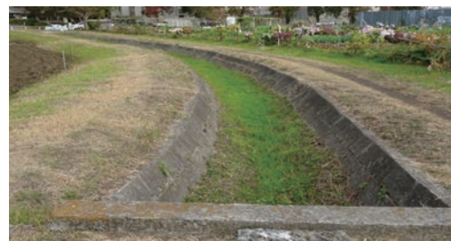
写真1 畑地灌漑事業・西幹線水路遺構