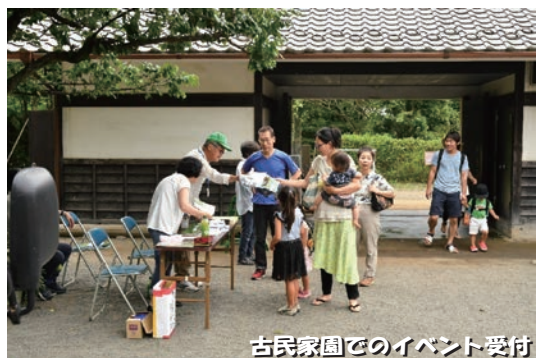
古民家園でのイベント受付