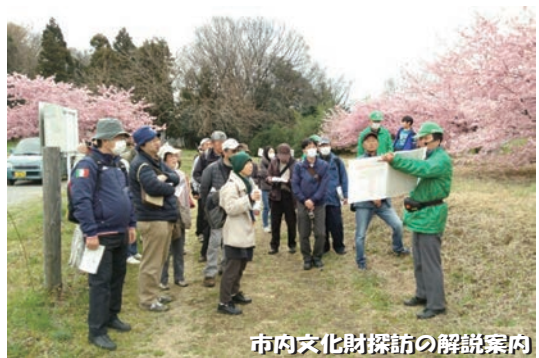
市内文化財探訪の解説案内