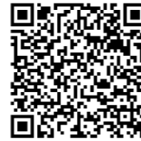
通学路改善要望箇所マップ