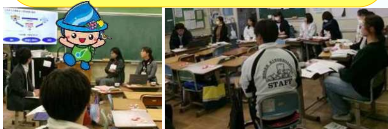
【Point】6月の幼保小連携研修で作成した