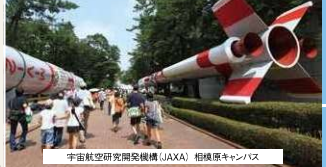
宇宙航空研究開発機構 (JAXA) 相模原キャンパス