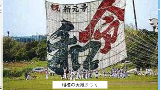
相模の大旗まつり