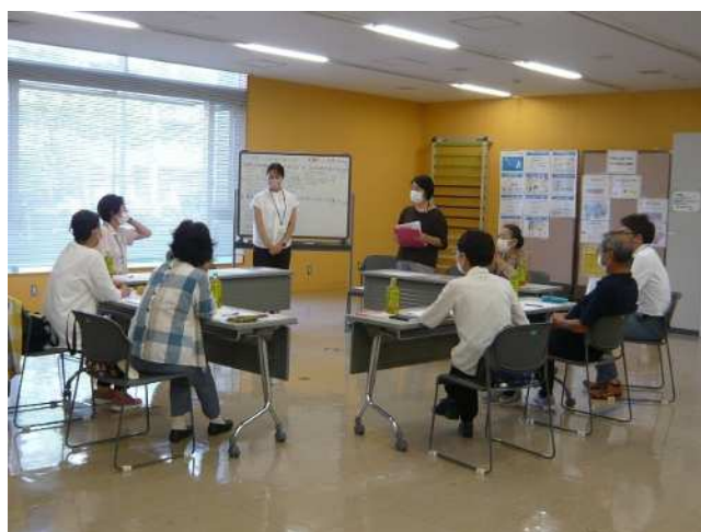
小地域の話し合い(相模大野5・6丁目)