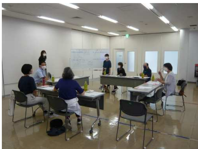
小地域の話し合い(文京)