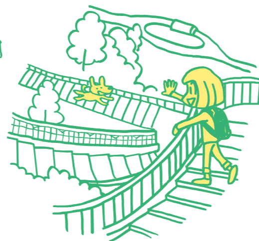
大沢「相模川自然の村公園」