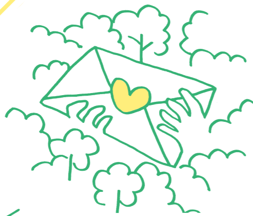
藤野「緑のラブレター」