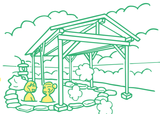
津久井「いやしの湯」