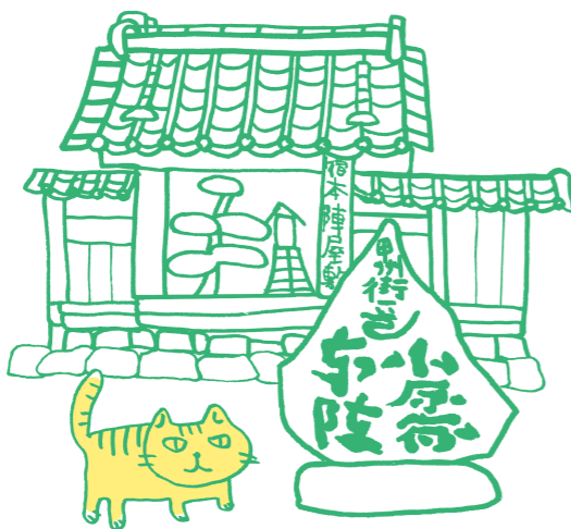
相模湖「甲州街道小原宿本陣」