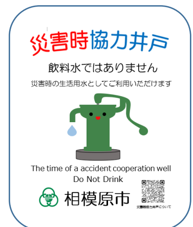
災害時協力井戸看板