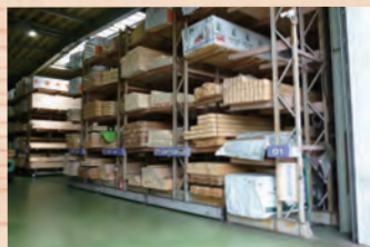
相模原木材センター