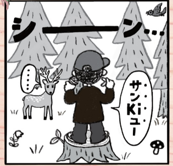
原作: M太郎 作画: さとうあや