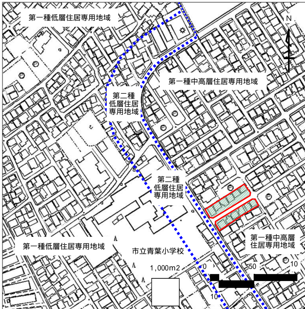
グリーントウン並木 建築協定 区域図

しかし、許容される種々の条件により様々な建築計画が想定されることから、将来にわたり良好な居住環境を維持及び増進させることを目的に建築協定が締結されました。