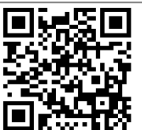
(4)(公社)神奈川県宅建協会[本部]