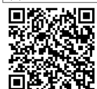
(3)㊤シティプラザ・はしもと