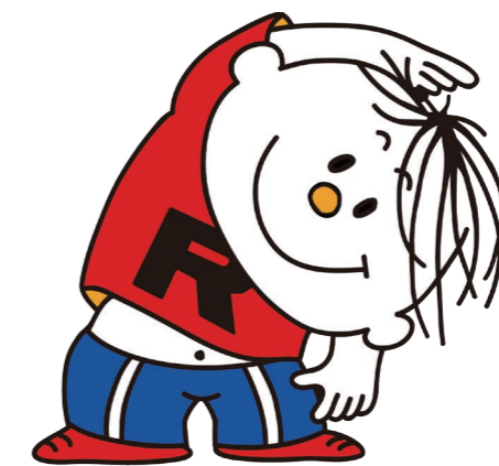
イメージキャラクター ラタ坊

○ラジオ体操の消費カロリー 体重50kgの人が15分間運動した際の消費カロリー (ラジオ体操は速いペースのウォーキングと同程度の効果があります)