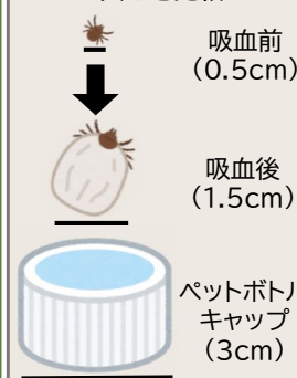
マダニ吸血前後の 大きさ比較