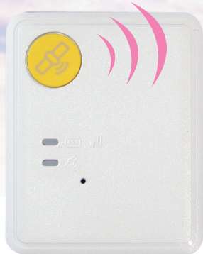
原寸大(縦47.5mm 横38.5mm 厚さ11.85mm)

専用の端末を貸し出し、利用者がひとり歩きする等行方がわからなくなった際に、GPS機能を利用して居場所をお伝えするサービスです。(委託先:ホームネット株式会社)