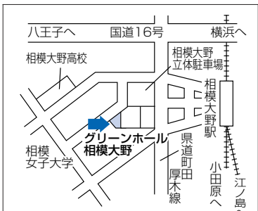
相模原南メディカルセンター (南区相模大野4-4-1 グリーンホール相模大野1階)