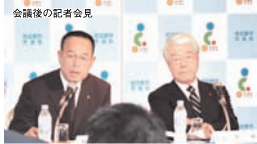
会議後の記者会見

5月11日、全国19の政令指定都市の市長による「指定都市市長会議」が本市で開催され、「地域主権に向けた取り組み」などについて話し合いました。