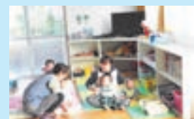
働きながらの子育ても安心

また、事業所内保育施設として「おひさま園」を設置するなど、従業員の働く環境作りに積極的に取り組み、市の「仕事と家庭両立支援推進企業」に選ばれました。同園では従業員の他、地域の乳幼児も受け入れ、また月1回の「おひさま広場」では地域の人たちも参加できる芋掘りなど楽しいイベントを行っています。