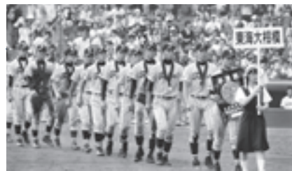
ロゴデザインが決定

8月、第92回全国高等学校野球選手権大会で東海大学付属相模高校が熱戦を繰り広げ、準優勝を果たしました。