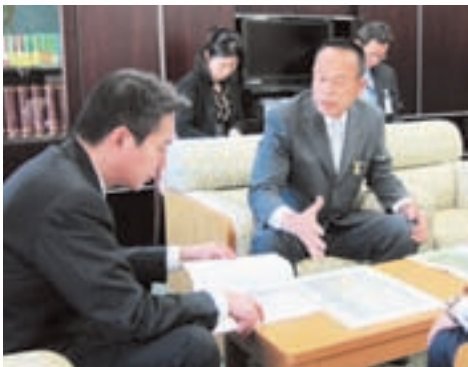
前原外務大臣(左)に基地問題の解決を要請する加山市長(右)

11月、本市と市米軍基地返還促進等市民協議会は、相模総合補給廠の一部返還・共同使用の早期実現や、同補給廠の焼夷弾処理、米軍機による騒音被害の解消、キャンプ座間ゴルフ場からのゴルフボール飛び出し問題などの米軍基地問題に関する要請を国・米軍等に行いました。