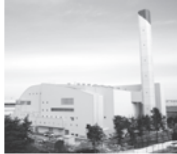
南清掃工場が竣工

3月15日、南清掃工場が新しく生まれ変わりました。高度な公害防止性と環境安全性、優れた省エネルギー性を持ち、ごみを適正に処理するとともに、スラグの生成・再利用など、循環型社会へ寄与する施設になっています。