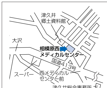
相模原西メディカルセンター (緑区中野1681-1)