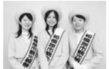
第4代観光親善大使