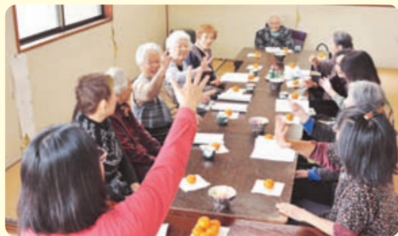
いきいきサロンなどの開催を通じて地域住民の交流に手を差し伸べる民生委員(手前)