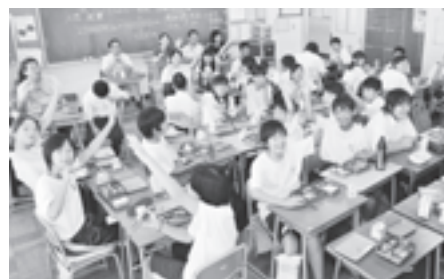
潤水都市さがみはらフェスタを開催

11月1日から、中央区の一部と南区の中学校で給食がスタートしました。市の栄養士が献立づくりから、食材の発注までを行い、安全・安心な給食を提供するとともに、望ましい食習慣の育成など、食育にも取り組んでいきます。