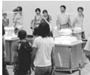
事業仕分けを実施

6月、小惑星探査機「はやぶさ」が数々のトラブルを乗り越え7年ぶりに地球に帰還し、JAXA相模原キャンパスで「はやぶさ」が持ち帰ったカプセルの開封と、分析が行われました。また、7月30日・31日にはこのカプセルを世界に先駆け市立博物館で公開し、全国から約3万人が訪れました。