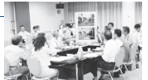
東海大相模が夏の甲子園準優勝

7月31日・8月1日、40事業を対象に事業仕分けを実施しました。市ではこの結果を受け見直しを行い、より効果的、効率的な市政運営を推進していきます。