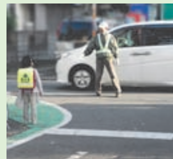
小学生の登下校時に子どもたちの安全を見守っています

何かと慌ただしい年末年始は防犯に関して手薄になりやすい時期です。地域での防犯活動が活発になれば、犯罪が発生しにくい環境づくり・犯罪抑止に効果があります。一人ひとりの防犯への心がけで安全・安心な年末年始を過ごしましょう。