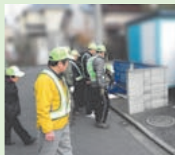
防犯パトロールでごみ集積所のチェックも行います

防犯パトロールは、毎月原則第2・第4週に挨拶や声かけをしながら道路のカーブミラーの角度やごみ置き場の点検も兼ねて地域を見回っています。この他に防犯ボランティアとして、「ワンワン隊」は犬の散歩のときに、「ウォーキング隊」は散歩をするときに、防犯の腕章をつけて見回りに協力してもらうことで、毎日地域内のどこかで誰かが防犯活動をしています。