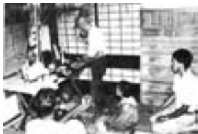
「相模原の年中行事」から