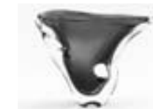
岩田藤七(花器) 1960年 新宿歴史博物館蔵