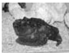
オニダルマオコゼ