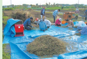
栽培・加工体験講座

お問い合わせ 北里大学薬学部附属薬用植物園 南区北里1-15-1 ☎042-778-9308