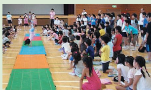
マット運動の発表会

串川小学校では健康教育の一環として、昼休みに1学期は「マット運動発表会」、2学期は「跳び箱発表会」、3学期は「短縄跳び発表会」「長縄跳び大会」を体育委員会主催で実施しています。各学年では発表会に向けて体育の授業や休み時間を使って、教え合いながら積極的に練習に励んでいます。また、長縄跳びの練習は異学年で構成する「なかよし班」で行います。6年生が1年生に教えながら楽しく練習しています。