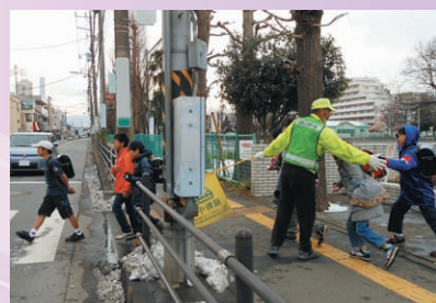
登下校時の見守り