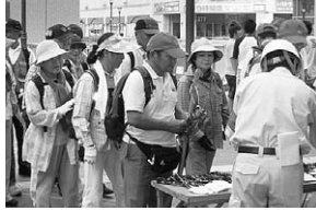
帰宅困難者対策訓練 (平成21年度実施)

多くの人が一斉に帰宅を始めると、駅周辺や道路が大混雑となり危険です。周囲の安全や交通機関の状況が把握できるまでは無理に帰宅しようとせず、安全な職場などにとどまりましょう。