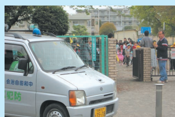
青バトによるパトロール