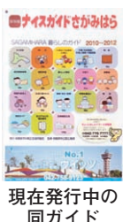
現在発行中の同ガイド

2月23日、市は市印刷広告協同組合と、防災や保健・福祉など市民生活に必要な情報を掲載する同ガイドの発行に関する協定を締結しました。