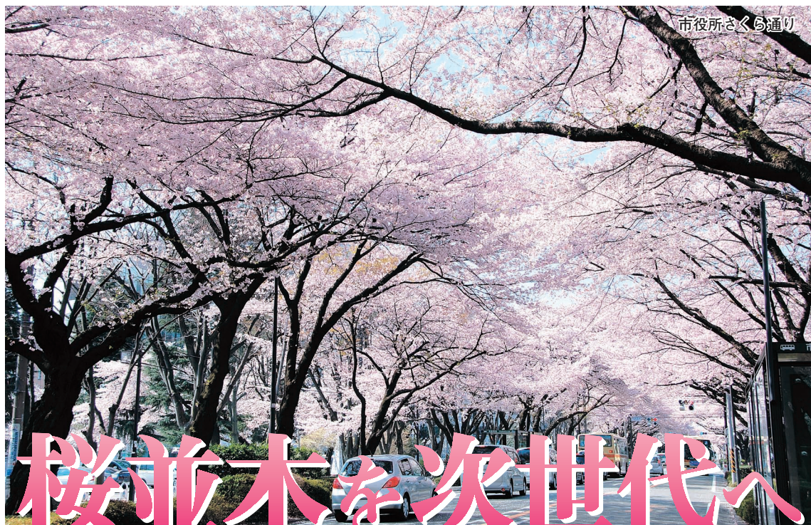
市役所さくら通り