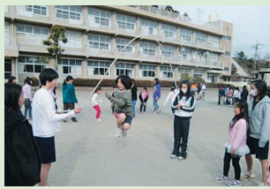
なかよし班による長縄跳びの練習