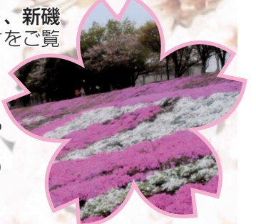
相模川新磯河川敷の芝ざくら

次の祭りは本紙4月1日号でお知らせします。 *おおさわ桜まつり 4月7日(土) 8日(日) ライトアップは 3月30日(金)～ 4月8日(日) 午後6時～8時 *相模川芝ざくらまつり 4月8日(日)～22日(日)