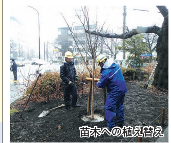
苗木への植え替え