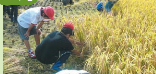
大切に育てた稲を収穫

とともに、子どもたち一人ひとりが心をこめて描いた「お弁当の掛け紙」を地区社協へ贈呈しています。高齢者に喜ばれることが、子どもたちの励みにもなっています。