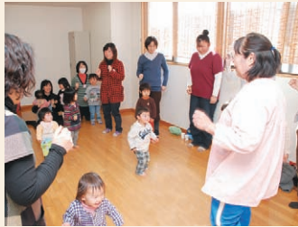
みんなで楽しく体操