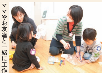
ママやお友達と一緒に工作