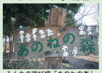
スローガンを背に「ハッシーくん」(左端) みんなの遊び場「あのねの森」