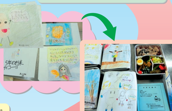
子どもたちが描いたメッセージ入り「掛け紙」で包装

地域みんなの心がこもった「お弁当」を民生委員（左）が届けます。受け取った人からは「メッセージが入った掛け紙も毎年楽しみにしています」などの言葉をいただきました。