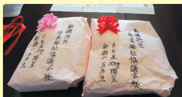
贈呈されたもち米

新磯小学校から贈られた「もち米」を地域のボランティアが調理して、民生委員が安否確認を兼ねてひとり暮らし高齢者世帯等に届け、地域の絆を深めています。