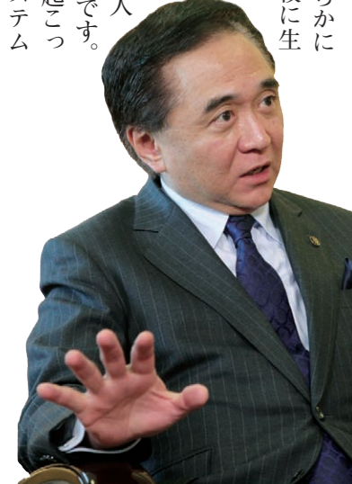
黒岩 祐治 神奈川県知事