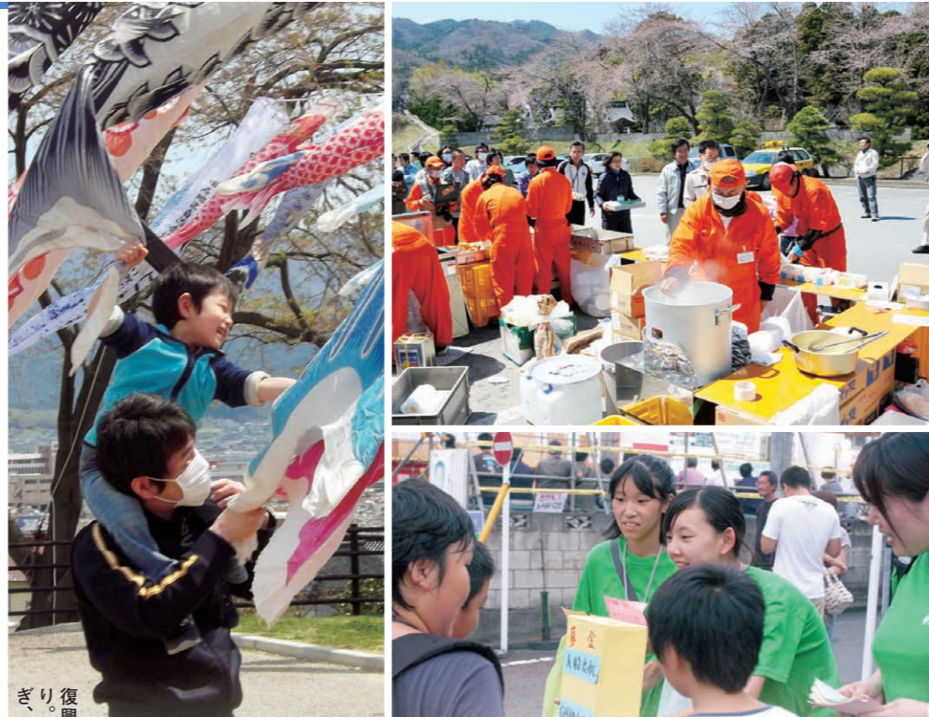
復興を願う相模原市民のこのほのほり。大船渡市内の広場で力強く泳ぎ、被災者を元気づけた昨年5月

基幹的防災拠点に相模原市へ — 今回の体験を教訓に、防災体制はどのように見直されるのでしょうか。 黒岩 東日本大震災が残した重要な教訓は、広域での連携が非常に大切だということです。 被害を受けた地域、受けていない地域がどう助け合い、乗り切るか。さまざまな状況を想定し、首都圏の九都府市首脳会議(※1)では、あらかじめどこが被害を受けたらどこを助けに行くか担当を決めておくなど、新しい連携体制をつくらうとしています。 加山 国の防災拠点は臨海部に集中しています。例えば、首都直下地震が起きた場合、その機能を十分に発揮できない恐れがあります。 内陸にある相模原市は、道路、鉄道のアクセス性に優れ、「首都圏内陸部の基幹的防災拠点」として、支援物資の中継や首