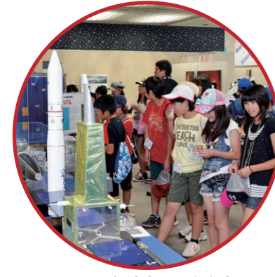
8月10日、大船渡市から小学生102人が相模原市に招かれた。相模原ビルレジ若若あゆに宿泊、JAXA相模原キャンパスの見学などを行った

基幹的防災拠点に相模原市へ — 今回の体験を教訓に、防災体制はどのように見直されるのでしょうか。 黒岩 東日本大震災が残した重要な教訓は、広域での連携が非常に大切だということです。 被害を受けた地域、受けていない地域がどう助け合い、乗り切るか。さまざまな状況を想定し、首都圏の九都府市首脳会議(※1)では、あらかじめどこが被害を受けたらどこを助けに行くか担当を決めておくなど、新しい連携体制をつくらうとしています。 加山 国の防災拠点は臨海部に集中しています。例えば、首都直下地震が起きた場合、その機能を十分に発揮できない恐れがあります。 内陸にある相模原市は、道路、鉄道のアクセス性に優れ、「首都圏内陸部の基幹的防災拠点」として、支援物資の中継や首