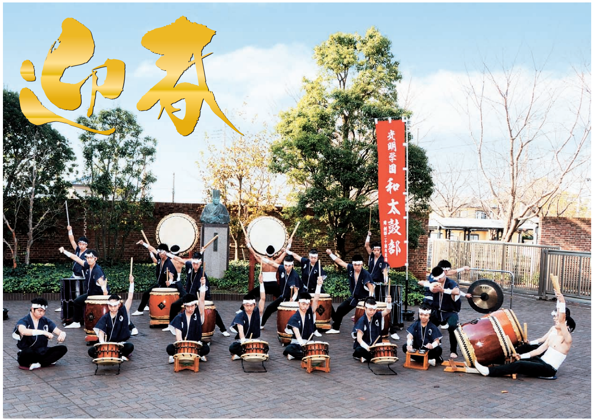
光明学園相模原高校 和太鼓部 昨年7月岩手県盛岡市で行われた、第35回全国高等学校総合文化祭郷土芸能部門に出場。戦国時代の壮絶な戦いをモチーフにした、オリジナル曲「陣」で、同部門最高位の文部科学大臣賞を受賞しました。 今年も先輩たちが築いた伝統を受け継ぎ、心に響く演奏を届けます。