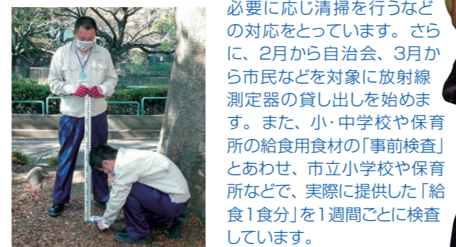
必要に応じ清掃を行うなどの対応をとっています。

市では、東日本大震災の教訓を生かし、各地域の実情に応じた、よりきめ細かな対応が図れるよう「相模原市地域防災計画」の見直しなど、さまざまな取り組みを進めています。 ●他自治体との連携：九都府市合同防災訓練への参加をはじめ、昨年9月1日には県央地域の8市町村で、災害時の相互支援、それぞれの友好都市などへの応援を盛り込んだ、「県央地域市町村災害時相互応援等に関する協定」を結びました。(※1)九都府市：埼玉県、千葉県、東京都、神奈川県、横浜市、川崎市、千葉市、さいたま市、相模原市 (※2)県央地域の8市町村：相模原市、厚木市、大和市、海老名市、座間市、綾瀬市、愛川町、清川村 ●在日米軍との協力：昨年10月26日、在日米陸軍と結んだ災害時の相互支援に関する覚書は、大規模災害などが市域で発生した際に物資の輸送などの相互支援を行うもので、市町村と在日米陸軍が覚書を結ぶのは全国初。また、12月6日には米海軍厚木航空施設とも同覚書を結びました。 ●放射能対策：福島第一原子力発電所の事故以来、市内29区画と小・中学校などの9施設で放射線量の測定(写真)を続けているほか、子どもが集まる施設などでは、必要に応じ清掃を行うなどの対応をとっています。さらに、2月から自治会、3月から市民などを対象に放射線測定器の貸し出しを始めます。また、小・中学校や保育所の給食用食材の「事前検査」とあわせ、市立小学校や保育所などで、実際に提供した「給食1食分」を1週間ごとに検査しています。