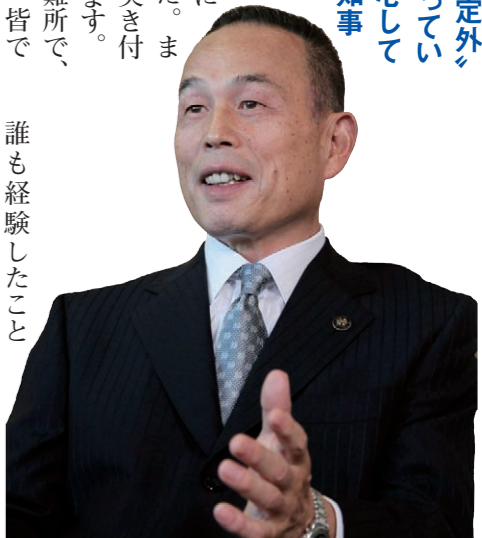
加山 俊夫 相模原市長