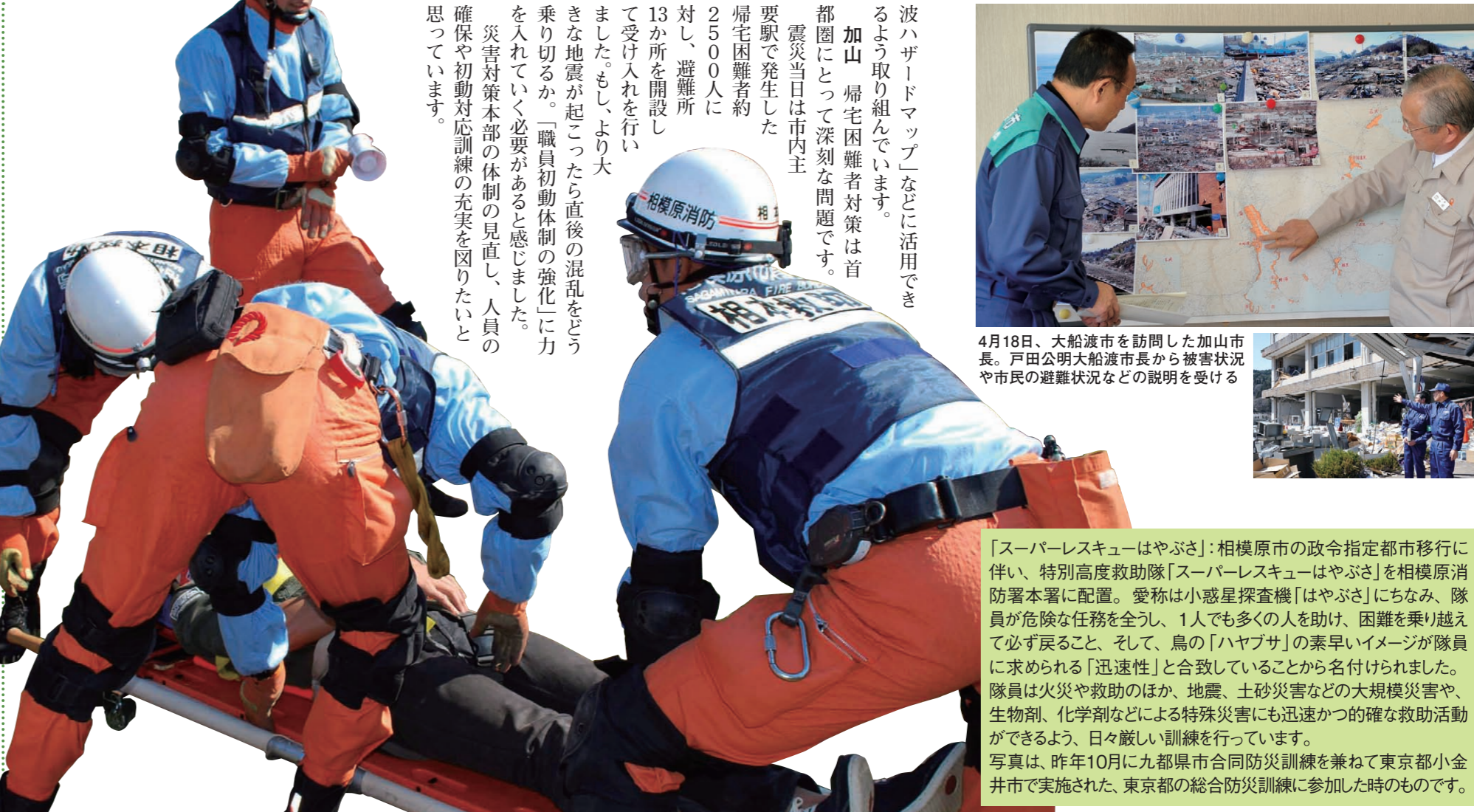
「スーパーレスキューはやぶさ」：相模原市の政令指定都市移行に伴い、特別高度救助隊「スーパーレスキューはやぶさ」を相模原消防署本署に配置。愛称は小惑星探査機「はやぶさ」にちなみ、隊員が危険な任務を全うし、1人でも多くの人を助け、困難を乗り越え必ず戻ること、そして、鳥の「ハヤブサ」の素早いイメージが隊員に求められる「迅速性」と合致していることから名付けられました。隊員は火災や救助のほか、地震、土砂災害などの大規模災害や、生物剤、化学剤などによる特殊災害にも迅速かつ確かな救助活動ができるよう、日々厳しい訓練を行っています。写真は、昨年10月に九都府市合同防災訓練を兼ねて東京都小金井市で実施された、東京都の総合防災訓練に参加した時のものです。