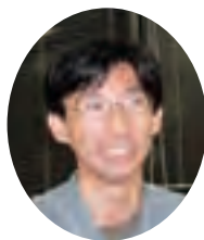
作者: 杉浦 康さん (豊町在住)

南区が未来に向かい、さらに豊かに発展していく姿をイメージし、思いを込めてデザインしたので区民の皆さんに末長く愛着を持っていただけると幸いです。