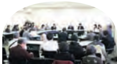
第6回区民会議の様子

日時 5月24日(火) 午後3時 会場 南消防署3階講堂 議題 南区の現状と課題のまとめとめざす姿について ほか 傍聴席数 40人(抽選) ※傍聴希望者は、午後2時45分までに直接会場へ