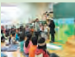
本の登場人物になって本を紹介

毎年、子どもたちの生き生きと表現する姿が好評で、本を介してふれあいの輪が広がっています。