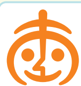
作者: 若林映人さん (相南在住)