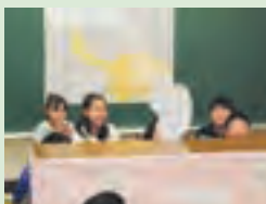
ペープサートで本を紹介