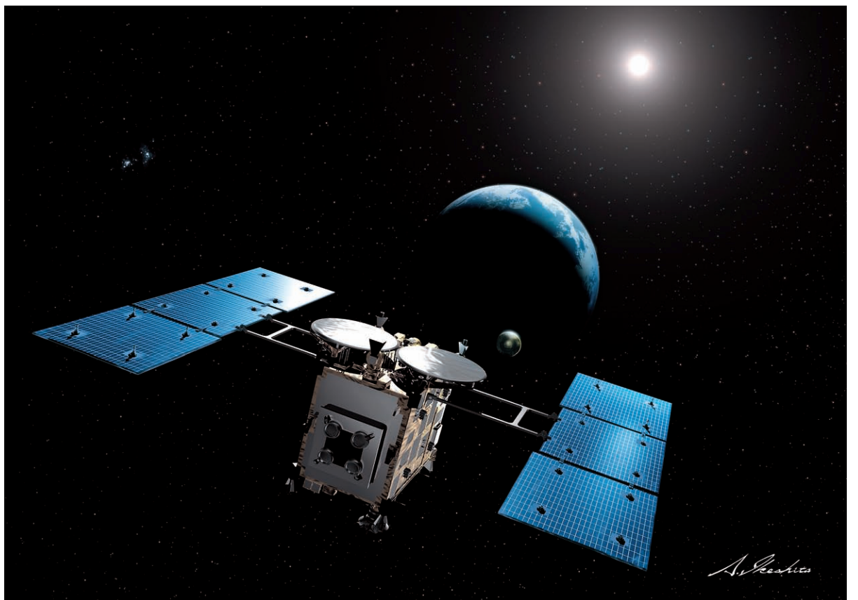
平成26年の打ち上げが予定されている小惑星探査機「はやぶさ2」(イメージ)