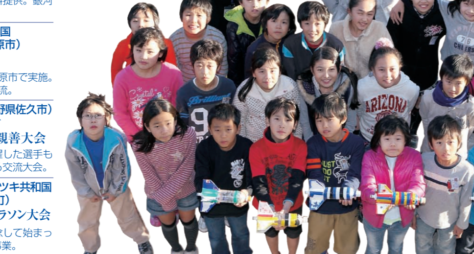
鶴の台小学校4年2組の皆さん。JAXAとの連携授業「ペットボトルロケットを飛ばそう」から

「はやぶさ」に続け 「はやぶさ」を越えていこう 日本の子どもたちに大きな感動と夢をもたらした「はやぶさ」の地球への帰還。本校に育てよう、今、4年生の授業のテーマに「宇宙」を取り上げました。そこで掲げた目標は「ペットボトルロケットを正確に着地点に到達させること」。