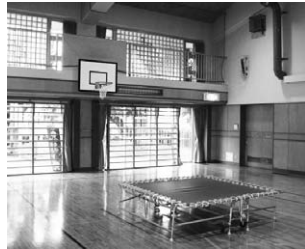
二本松こどもセンターの遊戯室