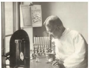
研究中の北里柴三郎