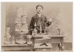
ドイツ留学中の一枚