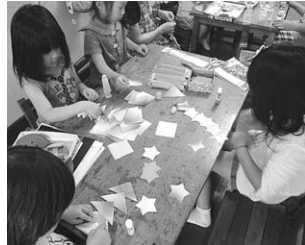
児童館で遊ぶ児童たち(こぼと児童館)