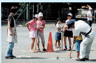
グラウンドゴルフ大会の様子