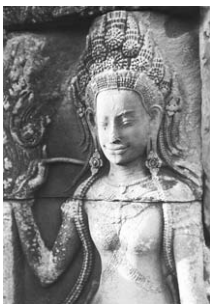
「微笑みの証」/バイヨン寺院 階上テラス/BAKU斉藤

期間 10月21日(日)まで 時間 午前10時~午後5時 (入館は午後4時30分まで) 会場 女子美アートミュージアム 休館日 火曜日