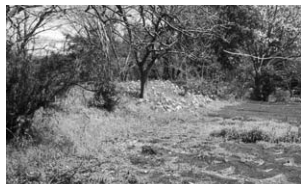
長尾景春の乱に登場する磯部城の土塁とされる「上磯部の土塁」

日時 9月23日(日) 午前10時~11時30分 会場 古民家園(相模川自然の村公園内) 定員 50人(先着順) ※希望者は直接会場へ