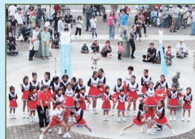
昨年のオータムフェア