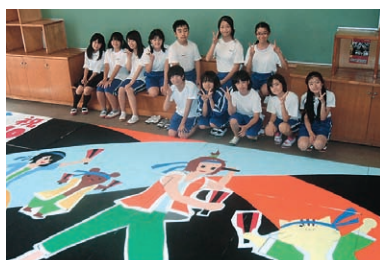
▲大野台中学校の作品

両校の生徒がそれぞれ構想から約1か月かけて描き上げたパネルは、祭り当日に12枚を組み合わせて設置され、祭りのステージ(2か所)を彩ります。