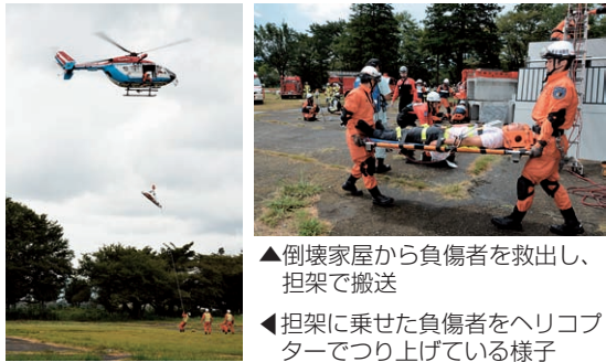
▲倒壊家屋から負傷者を救出し、担架で搬送