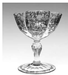
四曲ゴブレット(ボヘミア18世紀)/町田市立博物館蔵

期間 9月29日(土)~11月25日(日) 時間 午前9時~午後4時30分 会場 町田市立博物館(町田市本町田3562) 観覧料 300円 (中学生以下の方は無料、障害者は150円) 休館日 月曜日(祝日の場合は翌日)