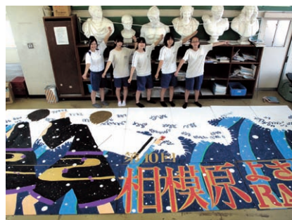
▲鵜野森中学校の作品

日にち 9月16日(日) 時間 午前10時30分～午後4時 会場 古淵駅前通りほか お問い合わせ 同実行委員会 (青史堂印刷内) ☎042-748-3921