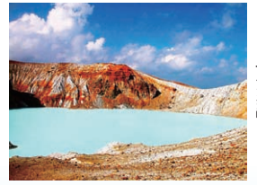
白根山の火口湖 「湯釜」

申し込み 往復はがきかファクスに全員 の住所・氏名(代表者に○)・年 齢・電話番号、「たてしな自然の村バスツアー」と書いて、6 月15日(必着)までに、たてしな自然の村(〒384-2309 長野 県北佐久郡立科町芦田八ヶ野赤沼平995 ☎0267-55-6776 FAX0267-55-7188)へ