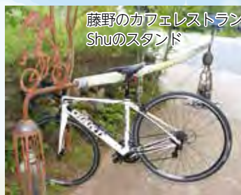
藤野のカフェレストラン Shuのスタンド

小学校1年生の時に自宅から相模湖まで往復40km以上の道のりを1人で冒険してから、自転車は大好きです。太陽や雨や風を感じながら、自分の力だけでどこまでも行ける最高の乗り物が自転車ですね。山、川、湖、何でもそろっている緑区は最高のサイクリングエリアです。僕のチームの選手たちもこの地域が大好きで、毎日トレーニングを重ねてどんどん強くなっています。子どもたちが安全にサイクリングを楽しむことができるよう、「Team UKYO」では実践的な自転車イベントを開催し、事故の怖さや自転車の楽しさを教えていきたいです。