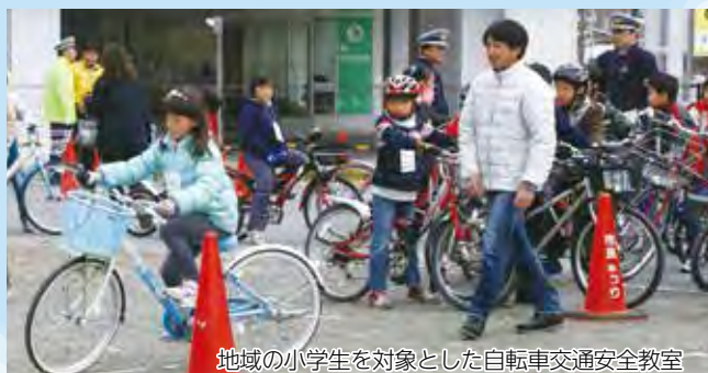
地域の小学生を対象とした自転車交通安全教室

本市に在住する相模原市名誉観光親善大使。元F1ドライバーで、現在は「Team UKYO」を設立し、自動車レースや自転車レースに参戦し、優秀な成績を収めている。