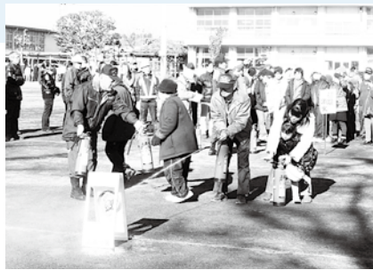
地域で行われた初期消火訓練

自治会は、防災訓練の実施や防災物資の備蓄、防犯灯の設置やその維持管理、登下校児童の見守り、地域の触れ合い活動など、皆さんにとってより良い地域となるよう、さまざまな活動をしています。