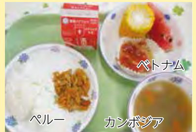
各国の料理を取り入れた給食

年2回、国際メニューを取り入れた給食を出しています。国際教室の子どもたちが調べてきた料理を基に、栄養士と相談してメニューが決まります。どの国の料理なのか、どんな料理なのか書かれた献立表も配布されます。