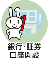
銀行・証券 口座開設