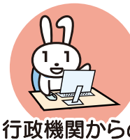
行政機関からの お知らせ・各種証明書