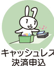
キャッシュレス 決済申込