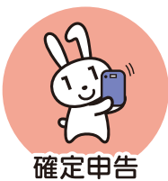
確定申告 (2024年度より)