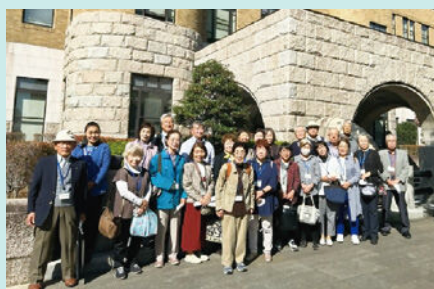
横浜地方裁判所前にて

南区明るい選挙推進協議会委員視察研修会として、午前中は横浜地方裁判所にて刑事裁判の傍聴を行い、午後はニュースパークにて新聞の歴史を学びました。