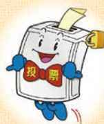
相模原市選挙啓発キャラクター 「アップくん」

頭部についている「鍵」。 前世が「投票箱」 だった名残で、 ふたが開かない ようにする鍵が ついてます。