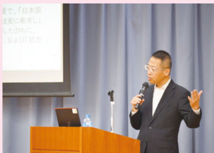
「選挙啓発講座」の様子