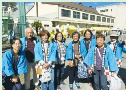
津久井やまびこ祭り

復活！地域のお祭りで啓発活動（令和5年10月21日（土）他） ～各地区の状況や課題について検討！～