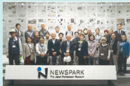
ニュースパークにて

裁判員として参加する可能性がある刑事裁判について、肌で感じることができ、とても良い経験になりました。