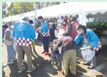
相原地区ふるさとまつり

今年は久しぶりに各地区でお祭りが開催され、多くの人でにぎわっている中、子どもから高齢者までの幅広い年代の方々に啓発活動を行うとともに、明るい選挙推進協議会の活動内容の紹介などを行いました。