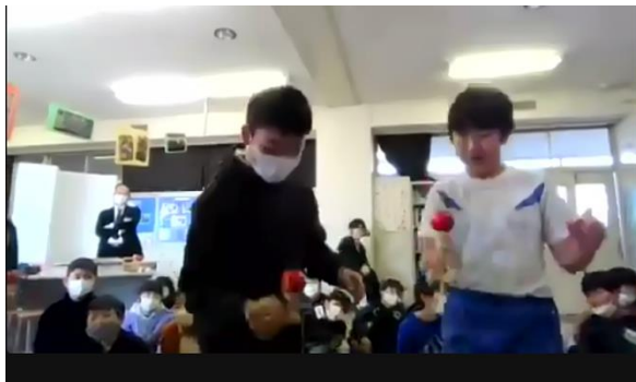
プレゼントの一つのけん玉の使い方を教えてくれている様子