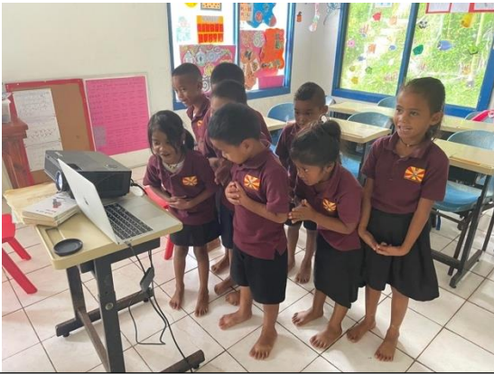
「ありがとう」とみんなで言っている様子

そして、今回は大賀小学校の児童が、自分達で育てたさつまいもを販売して得たお金で、ガラスマオの児童にプレゼントを買ってくれました。今回の交流では、使い方を実演してくれ、ガラスマオの児童も実演を見るたびに声を上げて喜んでいました。