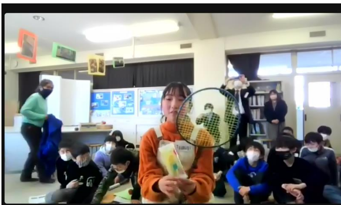
プレゼントの一つのバドミントンの使い方を教えてくれている様子