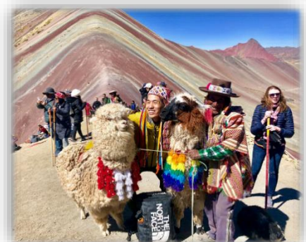
La montaña de siete colores

El origen de la ciudad significa "ombligo" en idioma quechua, era la capital en el Imperio Inca. Machupichi, la laguna de Humantay, la montaña de siete colores son mundialmente famosos en Cusco. Mi recomendación es la montaña de siete colores que está a 5000 metros. 2 voluntarios trabajan en Cusco.