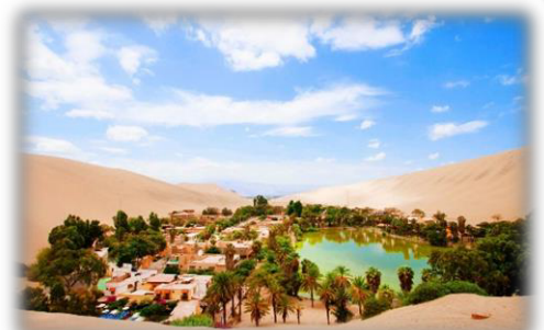
ワカチナ・砂漠に眠るオアシス

今回は、開催地ペルー・イカ州について紹介します。イカ州は、首都のリマからバスで 5 時間ペルー南側のコスタ(海岸沿い)に位置し、21 万人が住む都市です。 パラカス国立自然保護区 、 ワカチナ 、 ナスカの地上絵 が有名で、ブドウ、アスパラガス、玉ねぎを国外に輸出しています。また、イカ州で作られるピスコ(ペルー独自のブドウ酒)やワインはペルー国内外から高品質と評価されています。現在 JICA の協力隊員が 5 名活動しています。