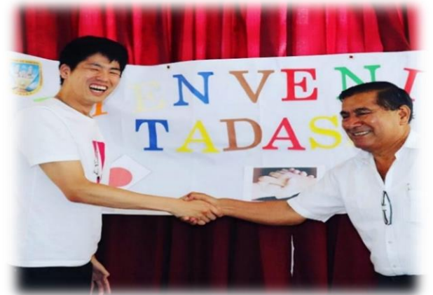
任地着任歓迎会、郡長との握手

街は、砂漠と海に囲まれています。郡役所の前には、街のシンボルのカトリック教会(San Martín de tours)と広場があります。この広場は、市民の憩いの場で多くの人が集まります。また、道には多くの野良犬がおり、噛まれると狂犬病の恐れがあるため趣味のランニングは出来ません。