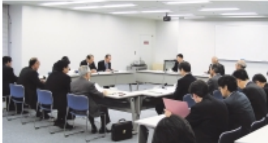
議員の定数等に関する検討委員会で検討する事項