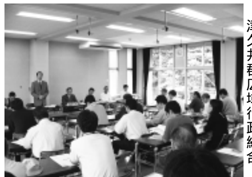
津久井郡広域行政組合