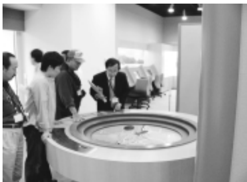
県立相模湖交流センター

また、第4回まちづくりの将来ビジョン検討委員会 相模原市のタウンウォッチングは、6月23日(水)に開催されました。詳細については、次号で紹介いたします。