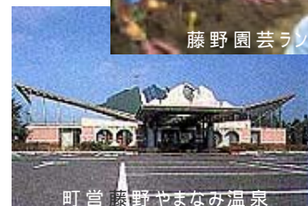
町営藤野やまなみ温泉