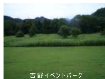
吉野イベントパーク

藤野町は急峻な地形条件から、限られた土地の中での秩序ある土地利用が課題となっています。一方、合併後の相模原の市街地とのバランスのとれた土地利用も重要となります。そのため、藤野町地域の中心となる藤野駅周辺の整備により、新市における北の拠点としての機能強化を図るとともに、限られた土地の有効活用による自然と環境を重視したまちづくりに努めます。