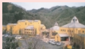
県立藤野芸術の家

泊まって、くつろいで、アートできる県立藤野芸術の家。芸術棟・宿泊棟・野外スペースから構成され、多くの人が様々な芸術体験をすることができる滞在型の芸術活動拠点です。陶芸・木工・ガラス細工などの創作をはじめ、音楽活動や演劇等のレッスンや発表、また、キャンプをしながらの自然観察にも最適です。