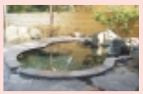
町営藤野やまなみ温泉

平成9年4月にオープンした町営藤野やまなみ温泉は、年間約12万人が訪れ、本年1月に来場者数100万人を突破しました。周囲に高い建物がないため、露天風呂からの眺めがよく、開放的な気分になります。