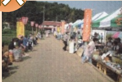
7 小松コスモスまつり(10月上旬) 川尻(小松地区)