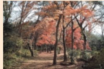
8 評議原のもみじ (11月中旬~下旬) 川尻(本沢梅園東側)