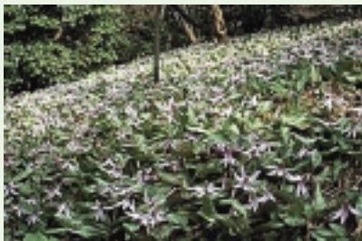
2 城山かたくりの里 (3月下旬~4月上旬) 川尻(小松地区)