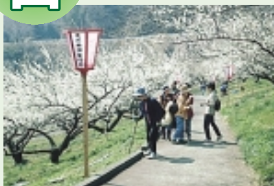
1 本沢梅園まつり (3月上旬~中旬) 川尻(城山湖付近)