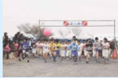
11 町民マラソン(12月上旬) 葉山島青少年広場周辺