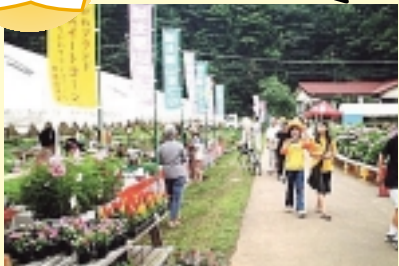
4 城北里山まつり(6月下旬) 蛸と紫陽花をテーマとしたまつり 川尻(城北地区)