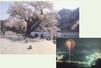
3 津久井湖の桜(4月上旬) 津久井湖さくらまつり 県立津久井湖城山公園