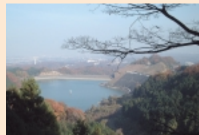
9 城山湖 [かながわの探鳥地50選]