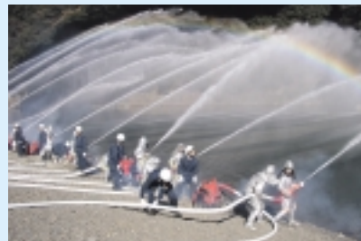
12 消防団出初式後の一斉放水 (1月初旬) 小倉(新小倉橋下)