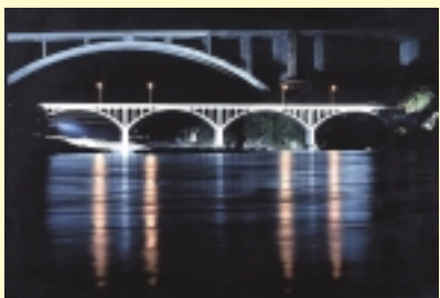
5 小倉橋のライトアップ (7月下旬~8月中旬) [かながわの橋100選]