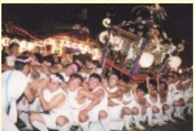
6 川尻八幡宮の夏祭り (8月27日・28日) [かながわの祭り50選]