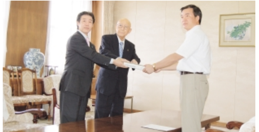
県知事へ合併申請書を手渡す (左から八木城山町長、小川相模原市長、松沢県知事)

6月23日の城山町議会、6月30日の相模原市議会において合併関連議案が可決されたことから、7月10日(月)に小川相模原市長と八木城山町長が、合併申請書を松沢県知事に提出しました。