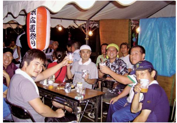
自治会活動を支える若手メンバー