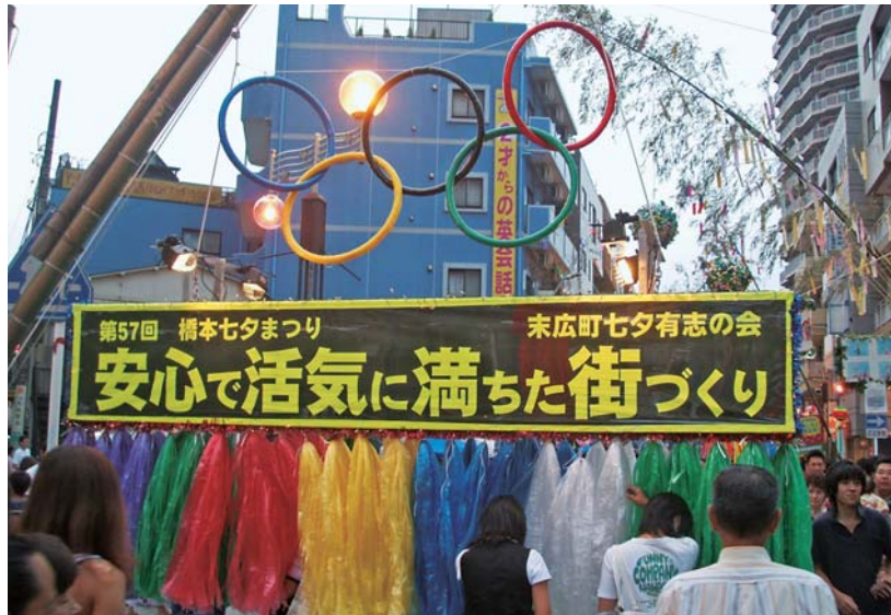
まちづくりスローガン