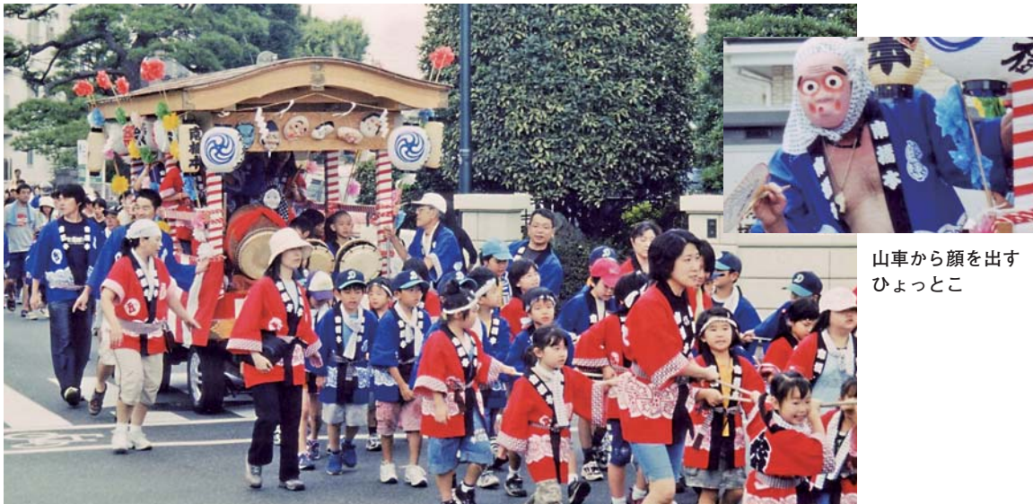
山車から顔を出す ひよっこ