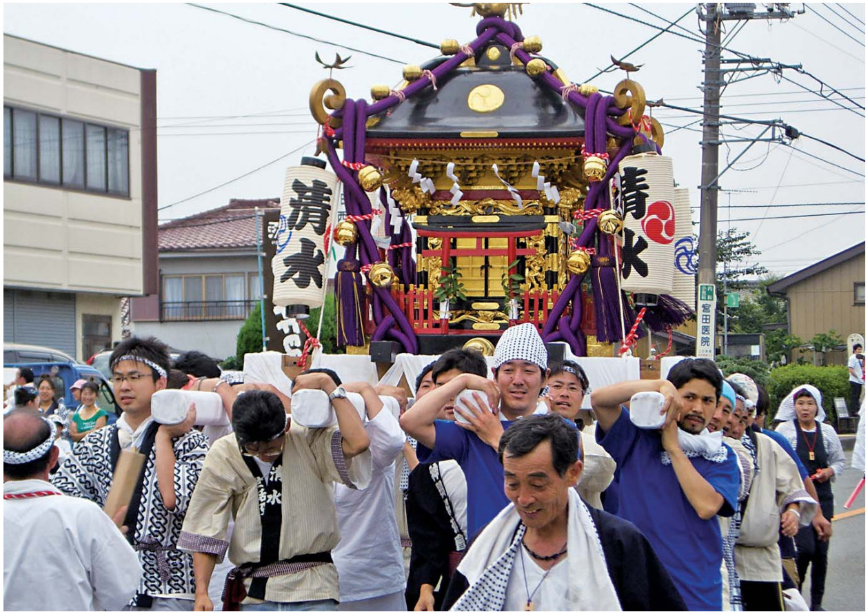
地域内を練り歩く神輿