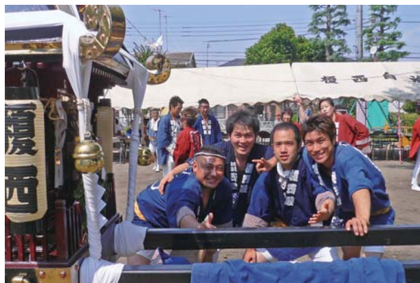
榎西自治会の若手のみなさん