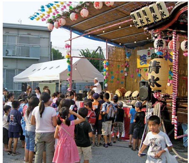
子どもで賑わう会場