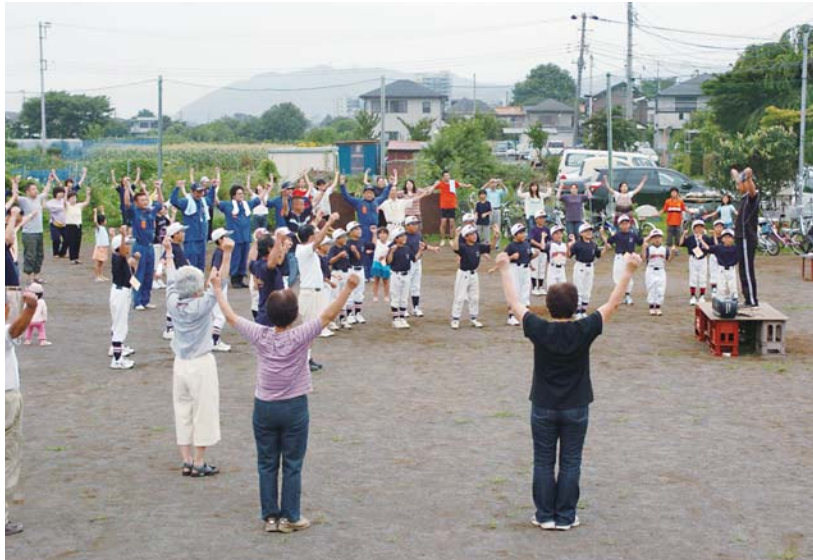
みんなで元気に、イチニ、サンシー