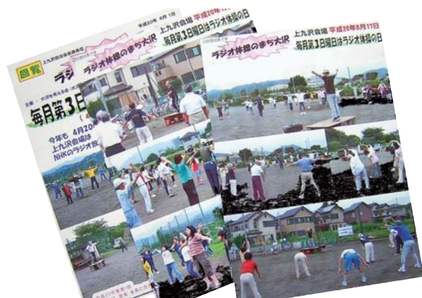
回覧はカラー写真が使われていて目を引く。みんなは載っているかな？