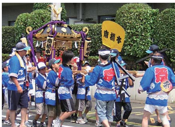
重いな、わっしょい

このような子どもたちのためにも、自治会加入を促進したいと考えています。南橋本は分譲マンションが増えています。様々な理由から加入者のほ