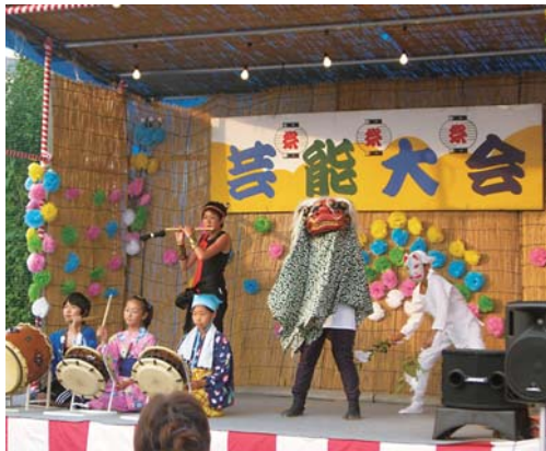
子どもたちのお囃子

運営にあたっては、運営マニュアルの作成、関連団体との役割分担の資料作りを事前に行うことが大切なことと考えています。このことから、約3ヶ月前の準備段階から役員同士の親睦会を兼ねて会議を持つなど負担軽減に努めることにより、夏祭りの伝統を守り、更なる盛り上げに繋がるよう工夫しています。 また、今後については、自慢の山車