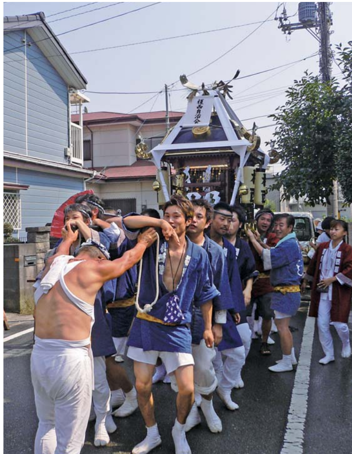
町内をねり歩く神輿