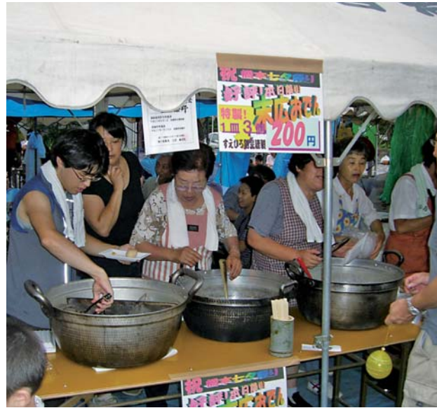
自治会伝統「名物末広おでん」