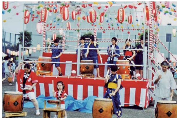
大迫力の盆踊り太鼓